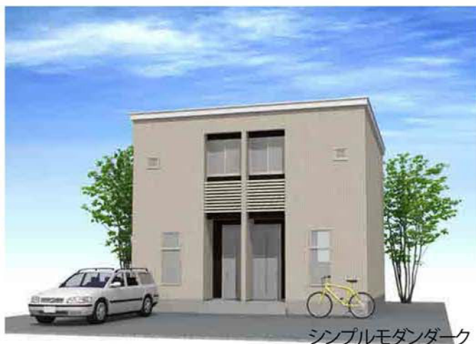
シンプルモダンダーク