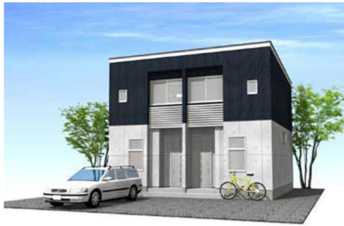
シンプルモダンダーク