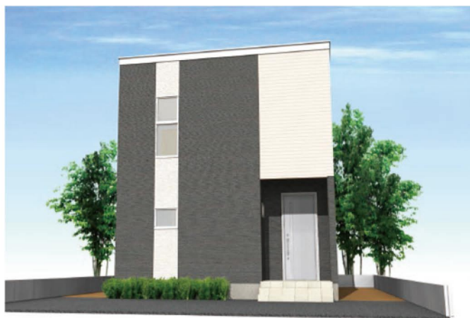
シンプルモダンダーク