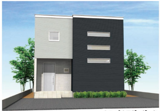
シンプルモダンダーク