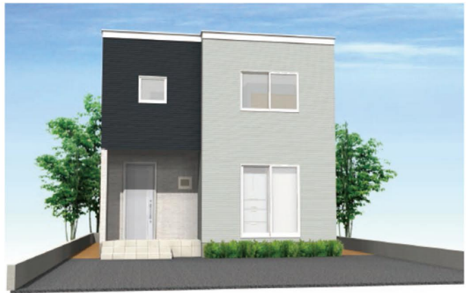
シンプルモダンライト